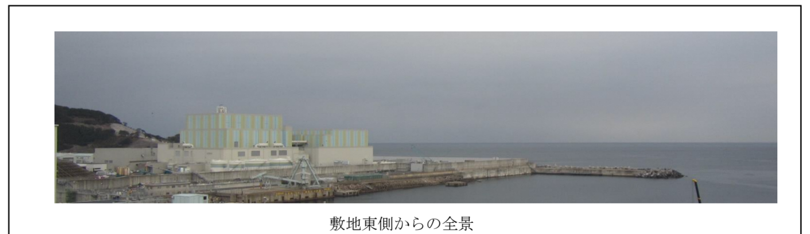
敷地東側からの全景