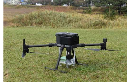
マルチコプタータイプ (ドローン)